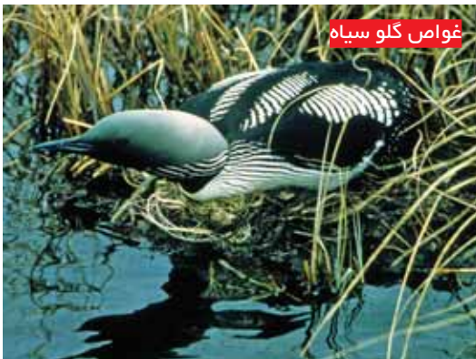
غواص گلو سیاه