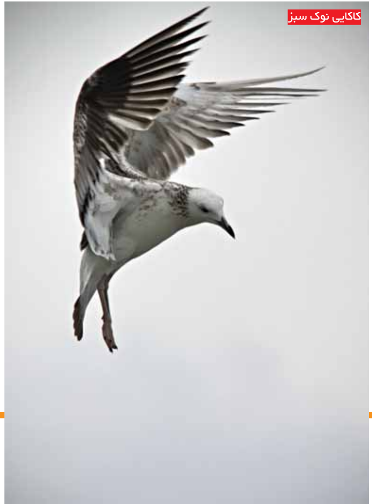
کاکایی نوک سبز